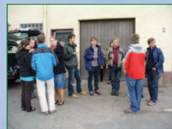
Ausflug der ehemaligen Israel-Mitarbeiter