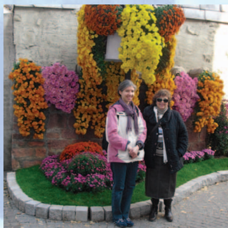
Besuch in der Chrysanthenstadt Lahr