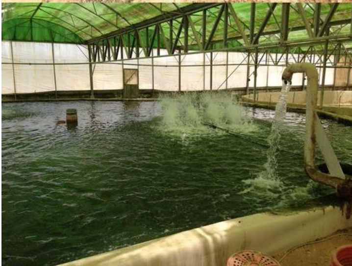
ISRAEL LAAD-Studenten im Negev erfahren über Fischzucht in der Wüste im Umweltstudium.