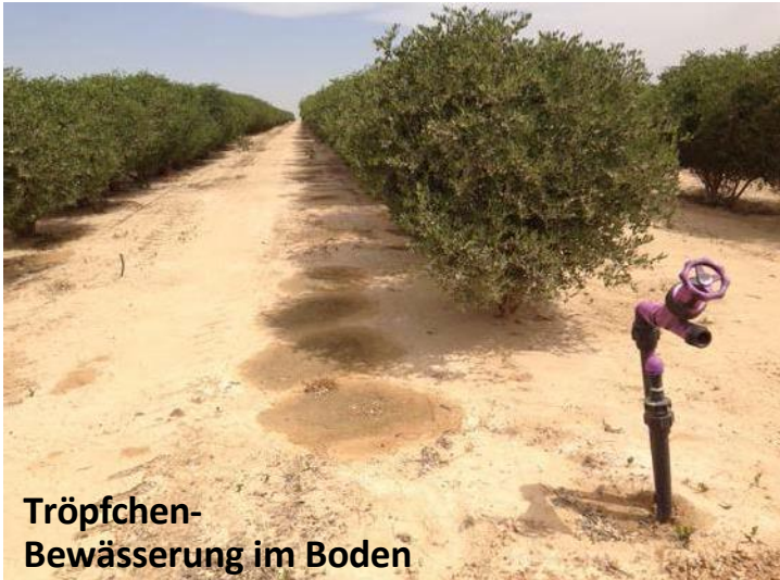
Tröpfchen- Bewässerung im Boden

Kontakt: Ari Lipinski@gmail.com , 0172-7161894, www.arilipinski.de