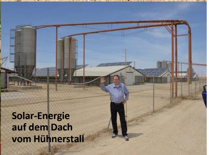
Solar-Energie auf dem Dach vom Hühnerstall