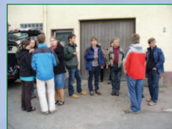
Ausflug der ehemaligen Israel-Mitarbeiter